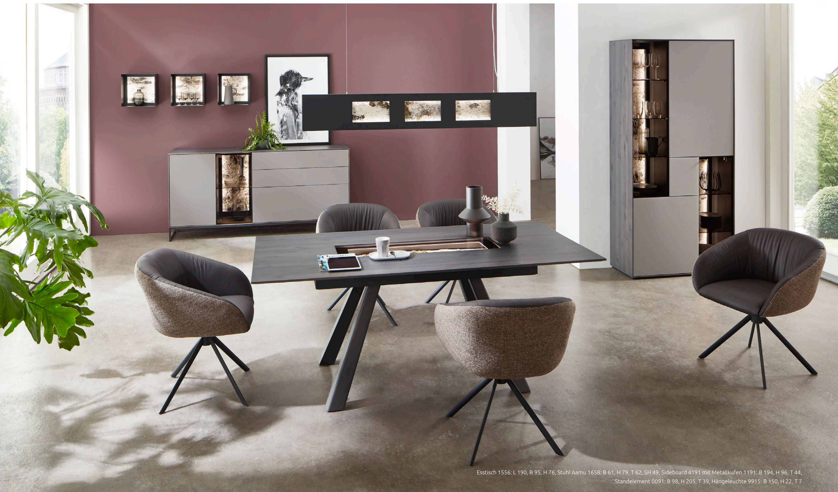
Esstisch 1556: L 190, B 95, H 76, Stuhl Aamu 1658: B 61, H 79, T 62, SH 49, Sideboard 4191 mit Metallkufen 1191: B 194, H 96, T 44, Standelement 0091: B 98, H 205, T 39, Hängeleuchte 9915: B 150, H 22, T 7