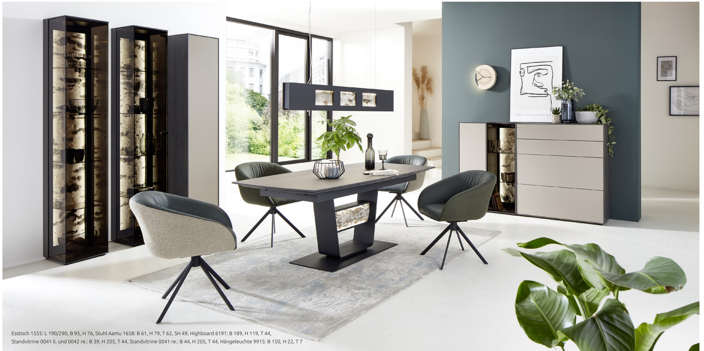
Esstisch 1555: L 190/290, B 95, H 76, Stuhl Aamu 1658: B 61, H 79, T 62, SH 49, Highboard 6191: B 189, H 119, T 44, Standvitrine 0041 li. und 0042 re.: B 39, H 205, T 44, Standvitrine 0041 re.: B 44, H 205, T 44, Hängeleuchte 9915: B 150, H 22, T 7