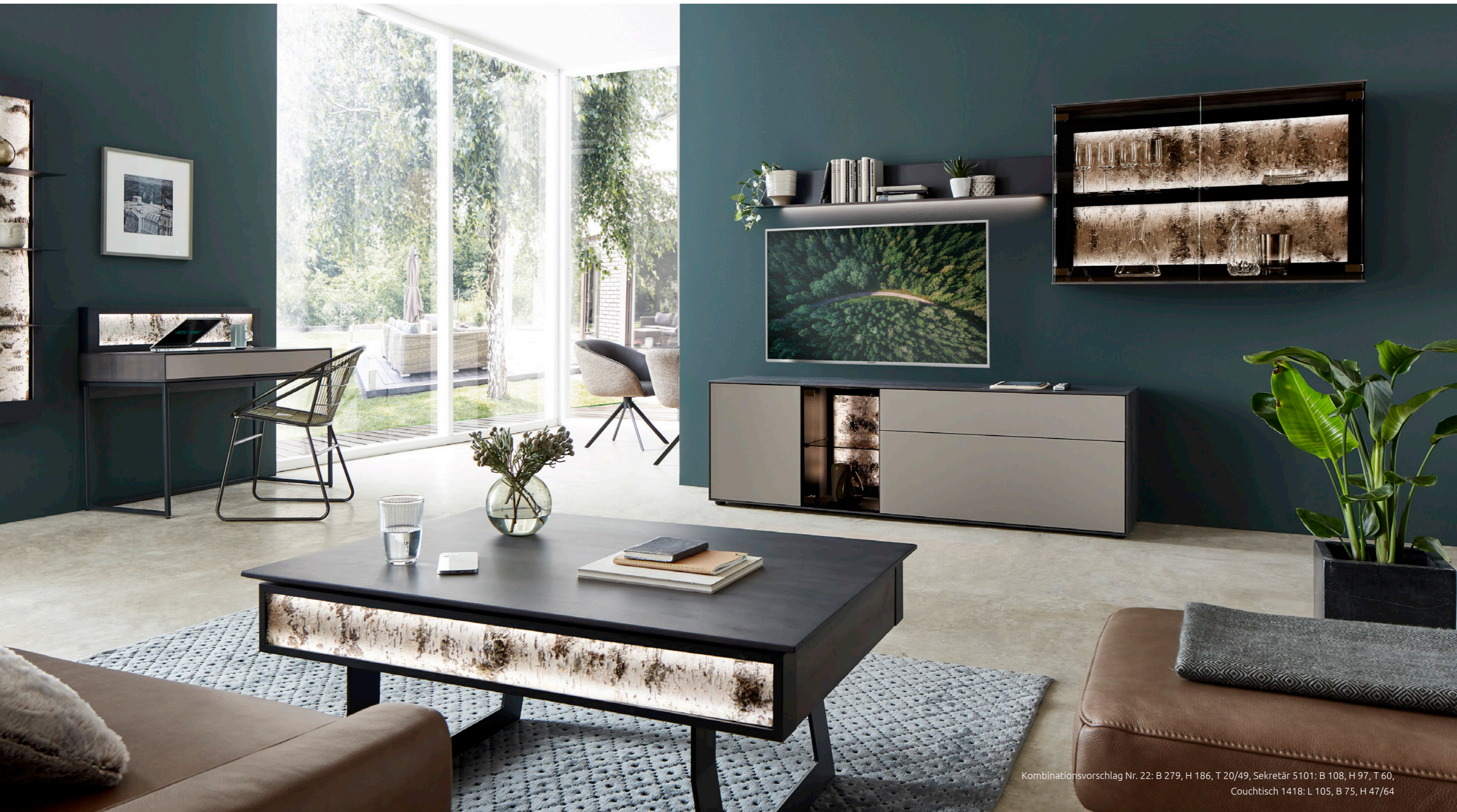
Kombinationsvorschlag Nr. 22: B 279, H 186, T 20/49, Sekretär 5101: B 108, H 97, T 60, Couchtisch 1418: L 105, B 75, H 47/64