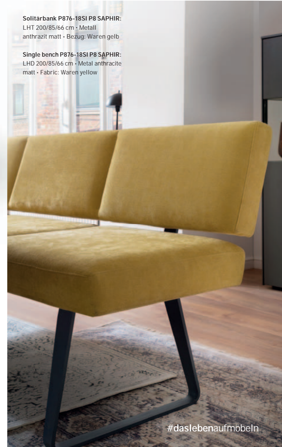
Single bench P876-18SI P8 SAPHIR: LHD 200/85/66 cm · Metal anthracite matt · Fabric: Waren yellow