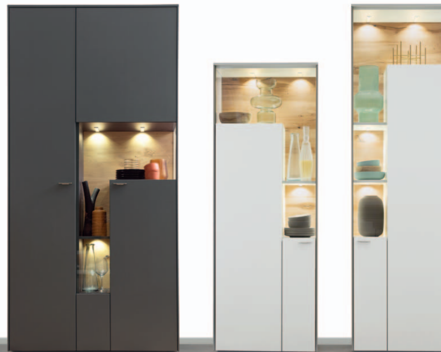
Vitrine 5295-3616R: BHT 102/207/43 cm • Lack schiefergrau matt, Wildeiche hell soft gebürstet geölt • Aluleiste schiefergrau matt Cabinet 5295-3616R: WHD 102/207/43 cm • Lacquered slate grey matt, Wild oak light soft brushed oiled finish • Aluminium ledge slate grey matt

This is the unmistakably exclusive signature of SENTINO 3000: The glass doors over the corner reveal the real wood veneer rear panel, look like an upside-down "L" and immediately give any room an ambience that's second to none. All the more so when they are illuminated.