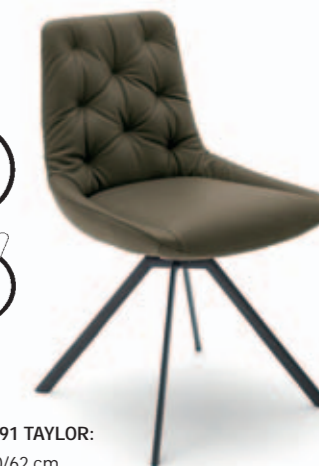
STUHL 2291 TAYLOR: BHT 53/90/62 cm