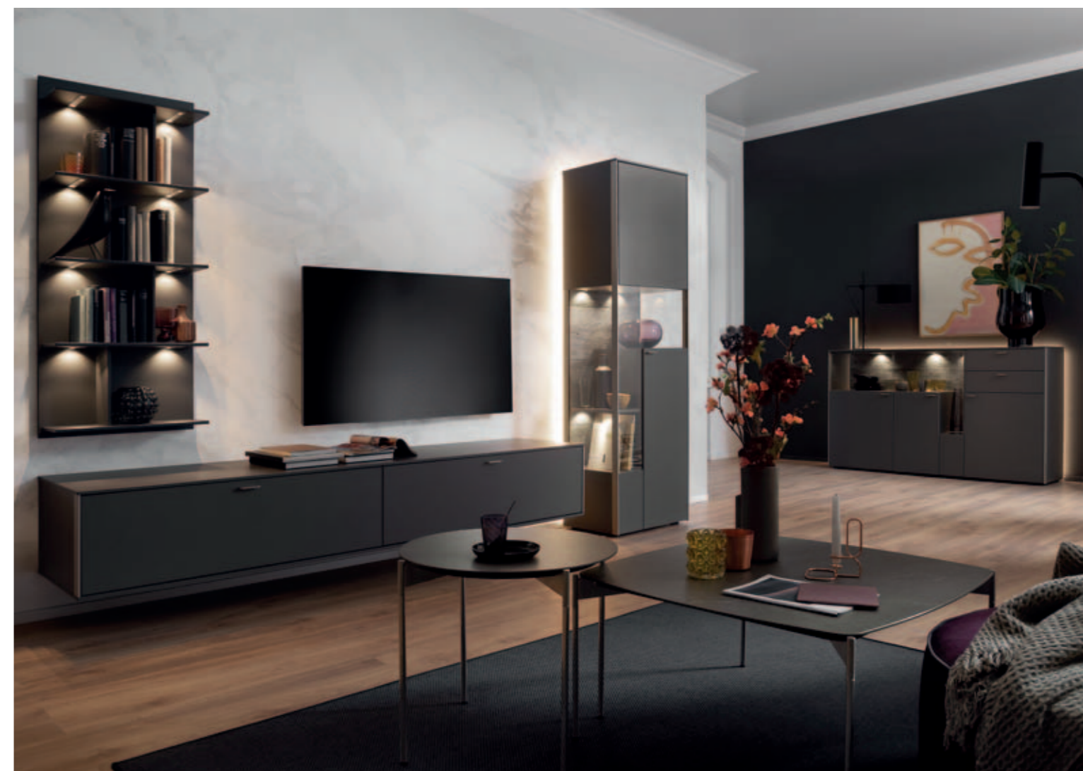
Kombination SI04-3617L: BHT 324/207/53 cm • Sideboard 5263-3617R: BHT 182/105/43 cm • Lack schiefergrau matt, Fjord Fichte grau • Aluleiste metallfarbig matt • Couchtisch 4942-1766M RIO: LBH 83/83/42 cm • Beistelltisch 4946-1766L RIO: LBH Ø 55/49 cm • Edelstahl optik, Keramik pazifikgrau