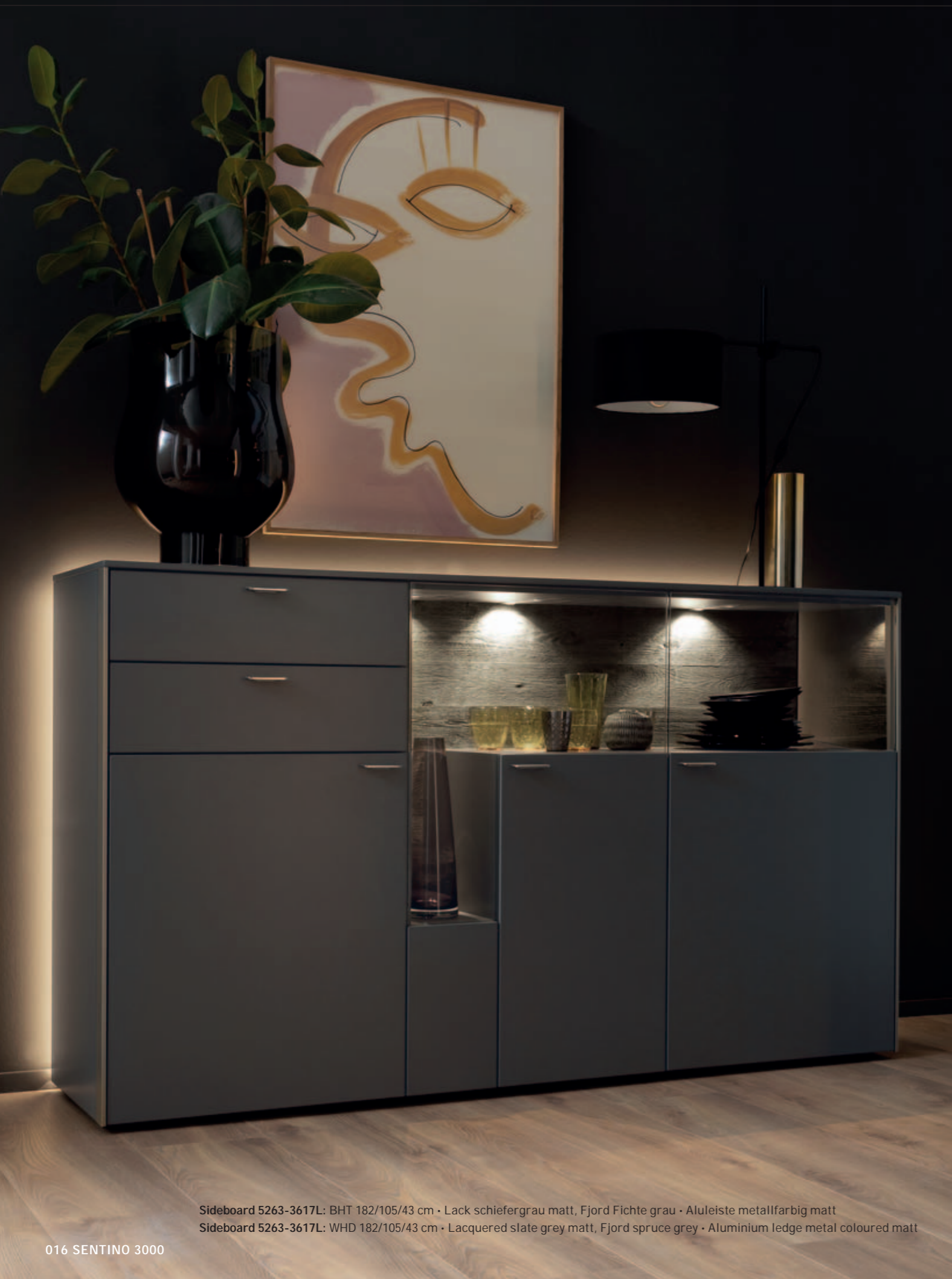
Sideboard 5263-3617L: BHT 182/105/43 cm • Lack schiefergrau matt, Fjord Fichte grau • Aluleiste metallfarbig matt Sideboard 5263-3617L: WHD 182/105/43 cm • Lacquered slate grey matt, Fjord spruce grey • Aluminium ledge metal coloured matt