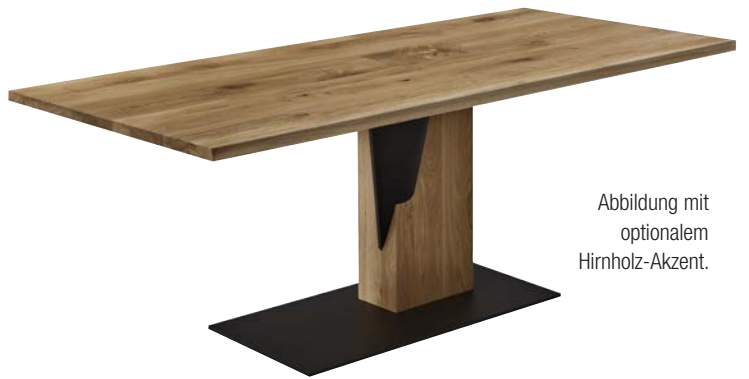
Abbildung mit optionalem Hirnholz-Akzent.

Höhe 77,0 cm Tischplattenstärke 4,0 cm Lichte Höhe 73,0 cm Maß Bodenplatte 100,0 x 50,0 cm