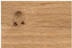
Wildeiche massiv, soft gebürstet