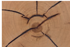
Hirnholz-Scheibe massiv, rissig