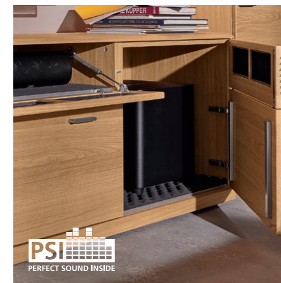
Korpuselement mit akustikwirksamer Innenausstattung Carcass element with acoustic interiors