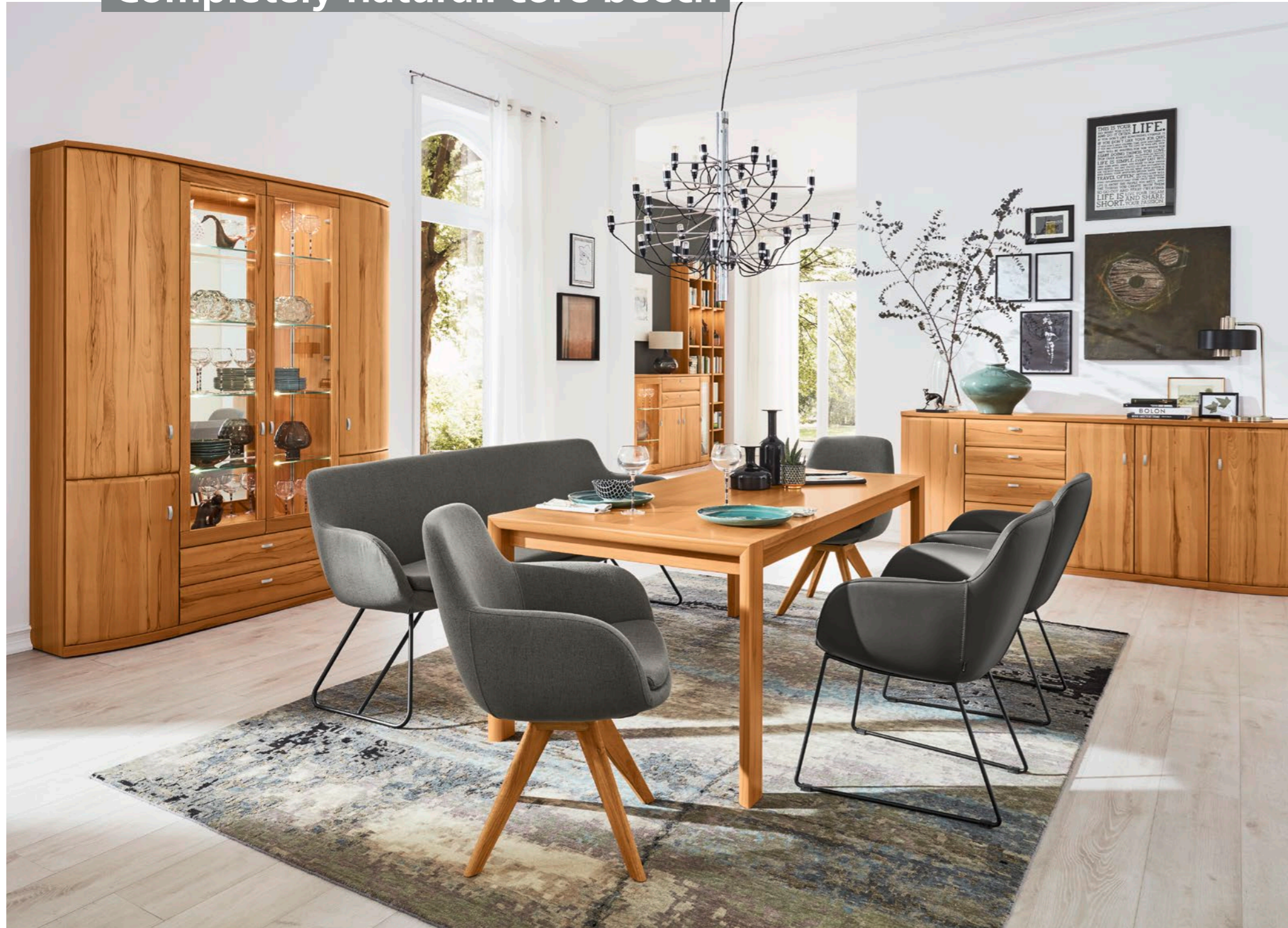
In Kernbuche: Vitrine 4897, ca. B 180, H 218, T 39 cm, Esstisch 90358 mit U-Wange, ca. 188 x 95, H 75 cm, Sideboard 66179, ca. B 225, H 95, T 49 cm Bank und Stühle TAVIA