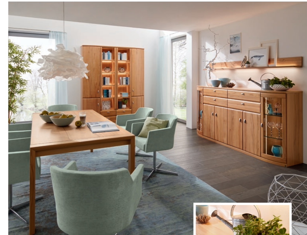
In Kernbuche: Esstisch 90360, ca. 208 x 95, H 75 cm, Vorschlag 66337, ca. B 180, H 218, T 39 cm Highboard 66555, ca. B 225, H 113, T 49 cm, mit Wandbord 8927, ca. B 225, H 17, T 19 cm Stühle PROVENCE