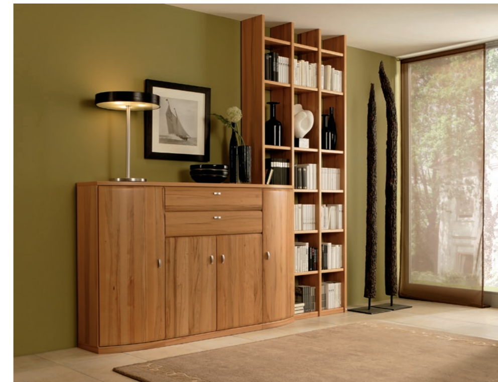
In Kernbuche: Sideboard-/Regalkombination 4704, ca. B 249, H 250, T 39 cm In core beech: sideboard/shelf combination 4704, approx. W 249, H 250, D 39 cm