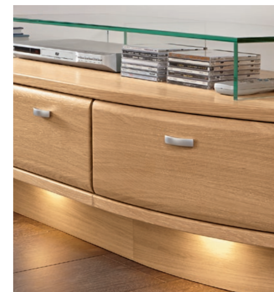
Gebogene Front mit LED-Beleuchtung Rounded front with LED-Lighting