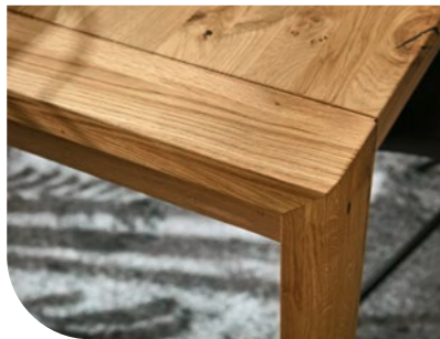
Esstisch (152 581), ausziehbar mit Klappeinlage, ca. L 180 (280), B 90, H 76 cm