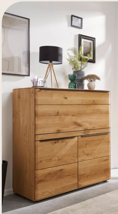
Sekretär (152 197), Asteiche massiv, bianco geölt, mit ausklappbarer Schreibplatte und schwarzem Lederbezug als Schreibunterlage, ca. B 122, H 124, T 47 cm. Zubehör: LED-Einbaubeleuchtung, Steckdose inklusive zweier USB-Ladeanschlüsse